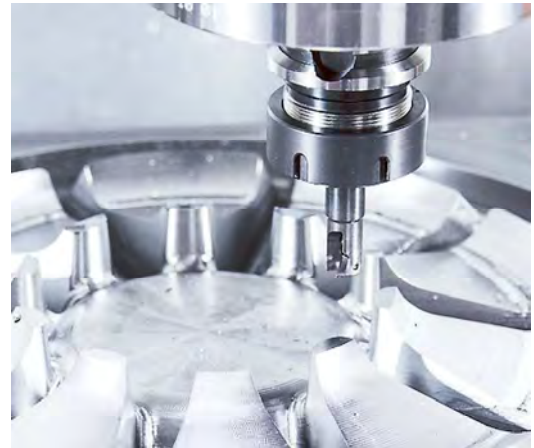
Zu den verschiedenen Maschinen, die bei der Firma Bühler eingesetzt werden, gehört etwa auch eine KF5600 von Hyundai Wia.

→ für den Kunden gewährleistet.“ Zum Service von Dieth Drucklufttechnik gehört auch eine Wartung alle 4000 Betriebsstunden. Über eine Fernortung kann das Unternehmen die Daten der Kompressoren auslesen und bei Handlungsbedarf den Kunden informieren.