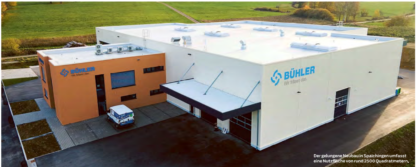
Der gelungene Neubau in Spaichingen umfasst eine Nutzfläche von rund 2500 Quadratmetern.