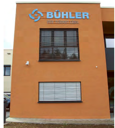
Im Jahr 1990 wurde die Bühler Metallbearbeitung GbR von Gerhard Bühler und Gerd Ulrich gegründet.