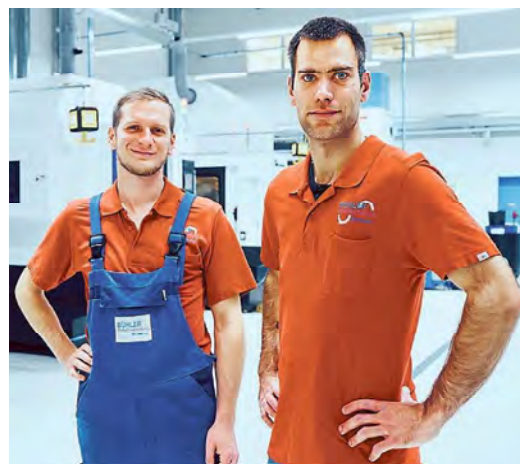
Dem Unternehmen Bühler ist es ein Herzensanliegen, dass sich die Mitarbeiter hier wohl fühlen. Darum wurde während des Neubaus auch darauf geachtet, ihnen ein angenehmes Arbeitsumfeld zu schaffen.