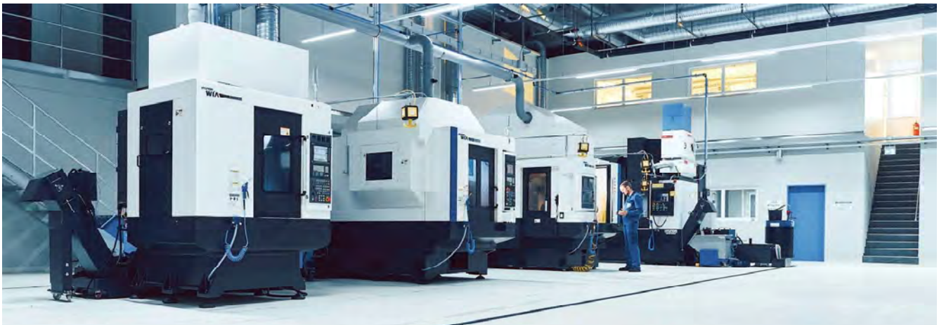
Der hochmoderne Maschinenpark der Firma Bühler Metallbearbeitung kann sich sehen lassen und umfasst neben verschiedenen Geräten der Firma Hyundai Wia (oben) unter anderem auch das Hochpräzisions-CNC-Dreh- und Fräszentrum s191H (unten) der DenKinger Firma Starrag.