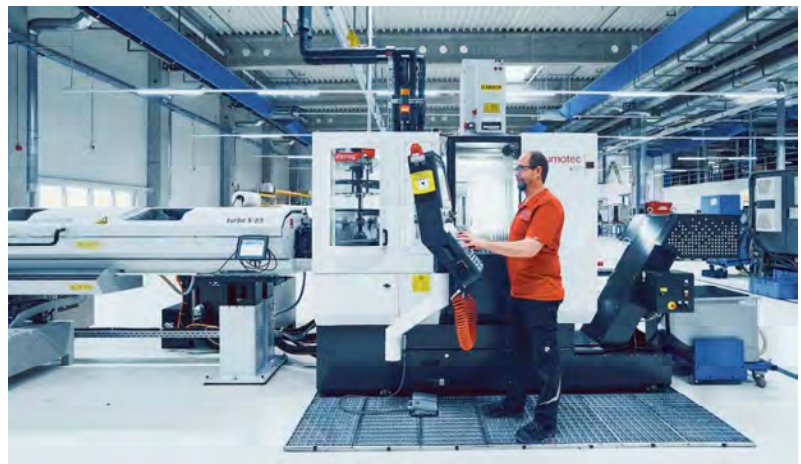
Zuverlässige und innovative Lösungen sind bei Bühler die Antwort auf die unterschiedlichsten Kundenanforderungen.