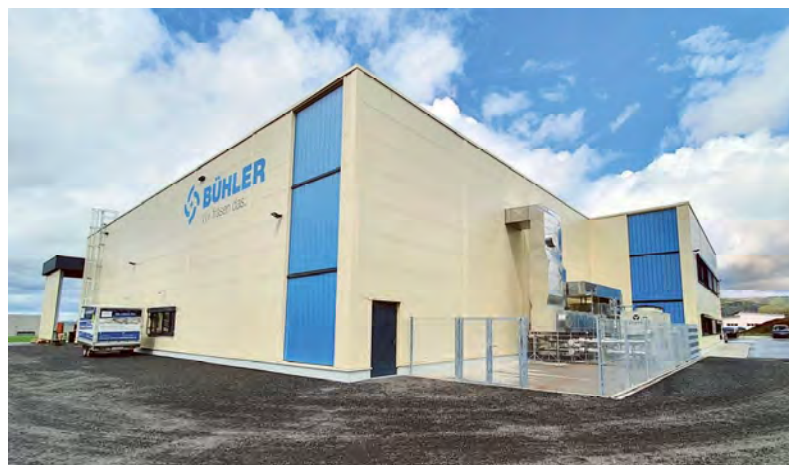
Als Spezialist für Frästechnik steht man bei Bühler der Kundschaft mit einem hochmodernem Maschinenpark und der Kompetenz für eine Vielzahl von Materialien und Prozessen zur Seite.