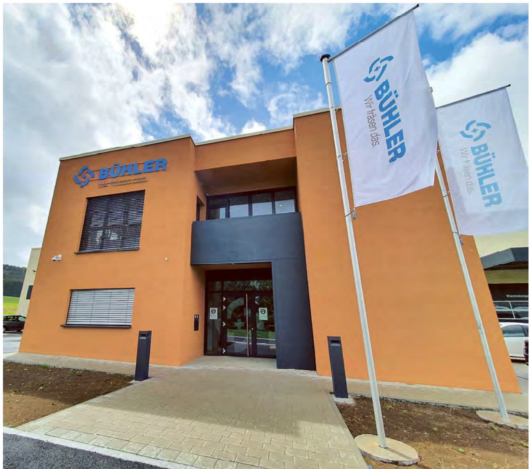
Der in Massivbauweise entstandene Neubau der Firma Bühler Metallbearbeitung ist energetisch voll auf der Höhe der Zeit. So wird beispielsweise die in der Produktion entstandene Abwärme zur Beheizung der Büros und der Produktionshalle genutzt.

Im Bürogebäude legt Bühler großen Wert auf modern gestaltete Besprechungsräume für interne und externe Schulungen sowie repräsentative Räumlichkeiten für Besucher und Kunden. Vor allem den 30 Mitarbeitern wurde ein Umfeld geschaffen, in dem sie sich wohlfühlen und in dem sie ihre maximale Leistung abrufen können. Für den Stressabbau steht ihnen ein Erholungsraum zur Verfügung. „Unsere Mitarbeiter sind unser wichtigstes Gut. Ohne sie könnten →