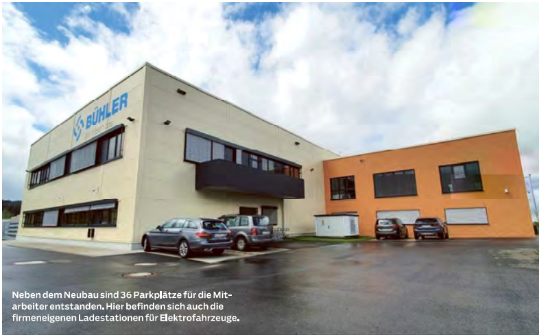
Neben dem Neubau sind 36 Parkplätze für die Mitarbeiter entstanden. Hier befinden sich auch die firmeneigenen Ladestationen für Elektrofahrzeuge.